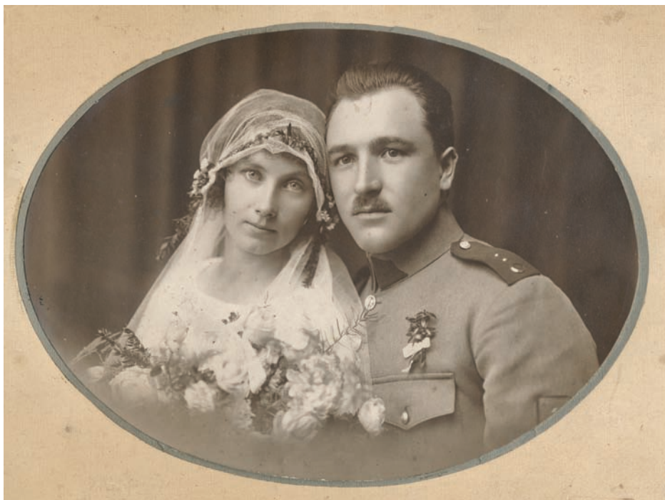
Svatební fotografie strážmistra četnictva ve slavnostním stejnokroji zavedeném pro strážmistry v roce 1925.

K žádosti o sňatek se pak vyjádřil představený velitel, který mimo jiné ve své zprávě uvedl, zda žadatel žije v „uspořádaných poměrech hmotných, zda nedostane se sňatkem do poměrů, které by se s postavením četníka nesrovnávaly a zda zamýšlený sňatek odpovídá co do výchovy a dosavadního života nevěstina požadavkům, jež dlužno klásti na každého příslušníka četnictva v zájmu nezbytné vážnosti stavu a služby“.