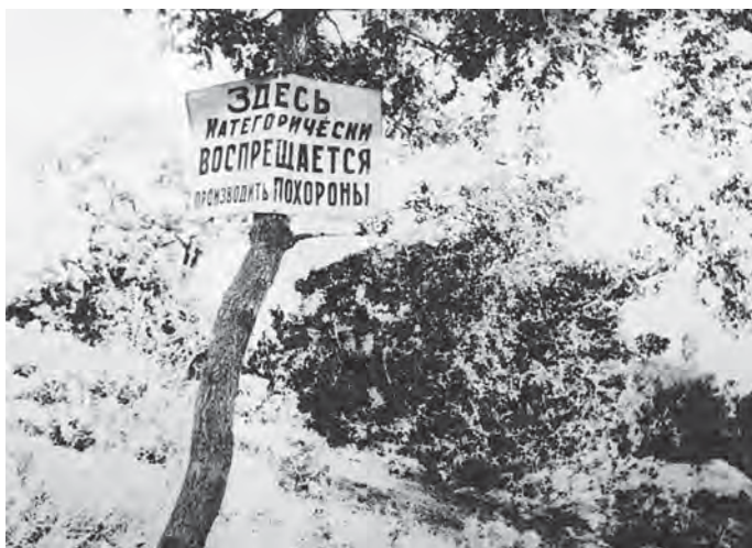
32.-35. Hladomor na charkovských ulicích.