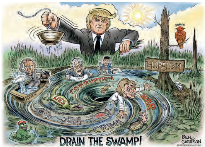
Obrázek 6.2: Vizuální ztvárnění Trumpovy metafory „vysoušení bažiny Washingtonu“ v karikatuře Bena Garrisona