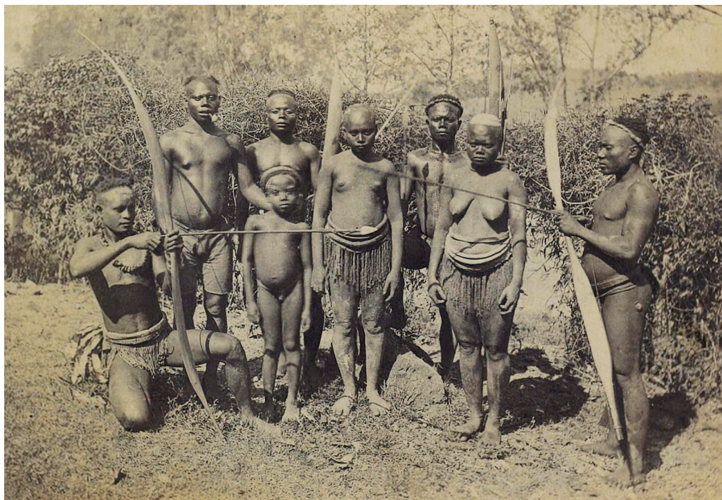
Obrázek 1-2. Andamanští ostrované fotografovaní roku 1890. Muži mají v rukou smrtonosné dlouhé luky.