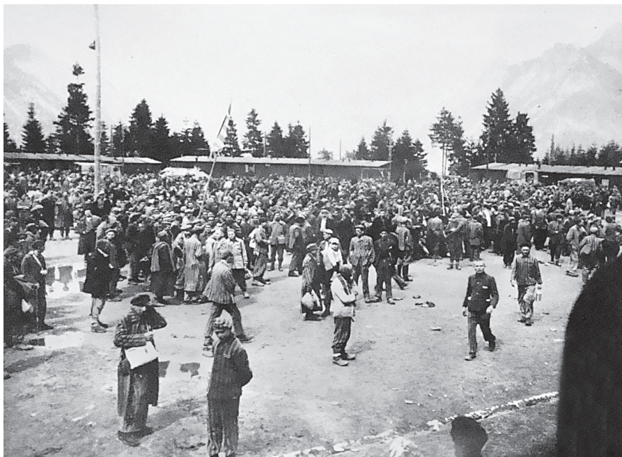
Pohled do tábora Ebensee v Rakousku v době po osvobození

o které hovoří? Můžeme vysledovat jejich prožívání dané situace a každodennosti? Propojily se různé skupiny přemístěných mezi sebou? Podíváme-li se na problém hlouběji, zjistíme, že skrývá rozsáhlou organizační strukturu a návaznost na mnoho dalších oblastí. Zahraniční badatelé „znovuobjevili“ otázku Displaced Persons několik desítek let po skončení války a osamostatnili ji od jejího dosavadního zahrnutí do předchozího či následného období. Na tento zájem navazuje i zde v knize prezentovaný výzkum a jedna z jeho ústředních otázek, zda je tato zkoumaná oblast relevantní rovněž pro českou, respektive československou historickou zkušenost.