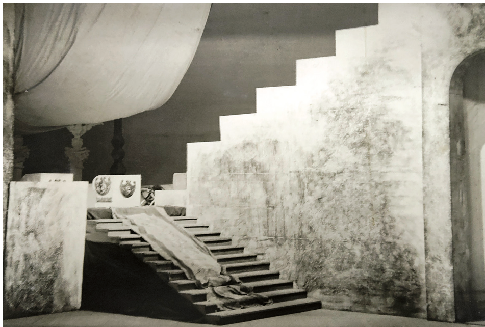
Scéna před arénou od Vlastislava Hofmana ze hry Otokara Fischera Otroci , 1925.

Sigmunda Freuda. 261 V recenzi Fischerovy hry Otroci si toho všiml i F. V. Krejčí, který připouští, že „se [Fischer – pozn. T. K.] nepouští příliš pronikavě do samého labyrintu freudovských problémů, nýbrž je jen [...] nadhazuje“. 262