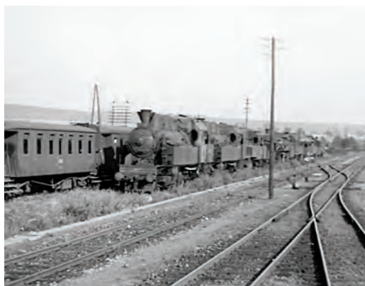
Lokomotivy odstavené po válce ve Svitavách, event. na jiném (neznámém) místě. Vlevo: lokomotivy řady 354.1, 324.218 (či 208) a 423.0. Vpravo: dvě lokomotivy z řady 354.1, za ní pak 423.0 a asi 365.0 nebo 534.0.