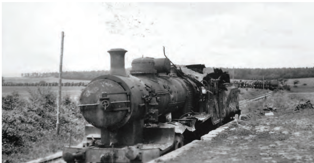
Lokomotiva řady č. 354.1 odstavená po válce u Jičina (David Šolc)