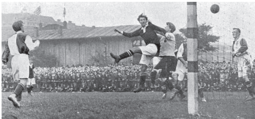
3. Zápas Slavie a Sparty (na hřišti Slavie) v roce 1913. V pozadí klubový pavilon sousedního DFC Prag, Český svět 1913

mistrovství Evropy amatérské fotbalové unie UIAF. Dne 8. června 1911 mělo na nádraží Františka Josefa přijít vítězné mužstvo oslavovat až několik tisíc příznivců. 30 (OBR. 3) V letech 1912–1914 se pak skokový nárůst zájmu o kopanou projevil i v diváckých maximech na tuzemských zápasech. Počty diváků se v tomto krátkém období více než zdvojnásobily. První zápas, u kterého dosáhl počet diváků pětimístné cifry, bylo přátelské utkání Sparty a Slavie 2. června 1912, krátce poté, co Sparta poprvé dokázala dosavadního hegemonu Slavii porazit a vzájemná utkání nabyla na atraktivitě. 31 Rekordní návštěvu před rokem 1918 přineslo derby pražských „S“ 12. dubna 1914 s asi 14 000 diváky, přičemž dalších několik tisíc údajně policie odmítla do hlediště vpustit. 32 (OBR. 4) Počty diváků na nejvýznamnějších utkáních tehdy narazily na kapacitní možnosti pražských hřišť, takže Sparta krátce před vypuknutím války plánovala vybudování stadionu pro dvacet až třicet tisíc osob. 33 To se uskutečnilo v roce 1917, ale poválečný boom zájmu o kopanou dokázal i zvýšenou kapacitu