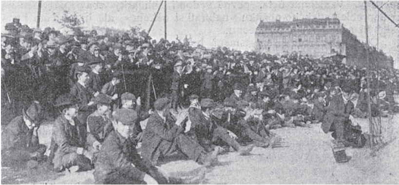
1. Diváci při fotbalovém zápase na Letné 1906. Převážně mužské publikum stojí za dřevěným pažením, které mělo zamezovat spontánnímu vstupu na hrací plochu. Před bariérou ještě v meziválečném období tradičně posedávali dětská diváci. Zcela vpravo za brankou jednoho z týmů lze spatřit v pokleku postavu fotografa s aparátem, Half-time 1906

Z neohrazenosti raných fotbalových hřišť vyplývala vedle osmotického charakteru raného diváctví 10 také multifokálnost dění. (OBR. 1) Už v polovině devadesátých let 19. století existovalo v Praze tolik fotbalových kroužků, že se souběžně v bezprostřední blízkosti odehrávalo hned několik fotbalových zápasů. V neděli 17. listopadu 1895 tak byla například Císařská louka poseta footballmatchi . Konalo se zde šest utkání, dalších pět probíhalo na Letné a u Invalidovny. Diváci tak běžně přecházeli od hřiště k hřišti podle aktuálního průběhu zápasu. Pluralitu ohnisek ostatně odrážely i první pokusy o malířské zobrazení kopané v českém prostředí. Výtvarník Miloš Jiránek nejdříve v přípravné skice k zamýšlenému velkému fotbalovému plátnu zachytil dvojici souběžně hraných utkání, jak byl zřejmě zvyklý kopanou vidat v plenéru, ale bez kýženého estetického efektu. Celek působil nepřehledně. Teprve později si uvědomil nutnost redukovat dění na dynamiku momentní scény jediného utkání. 11