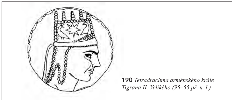
190 Tetradrachma arménského krále Tigrana II. Velikého (95–55 př. n. l.)