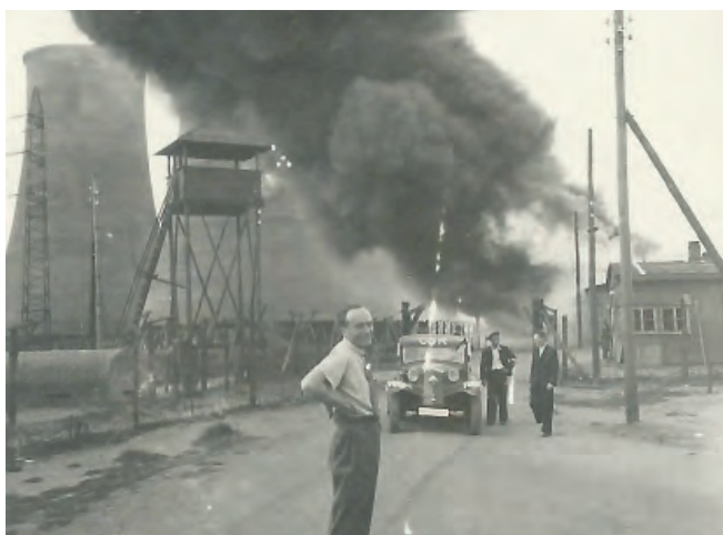
Pálení tuberkulózních baráků