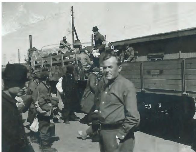
Nemocní ruští zajatci opouštějí tábor