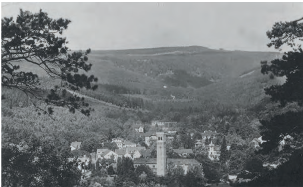
Dubí na dobové pohlednici