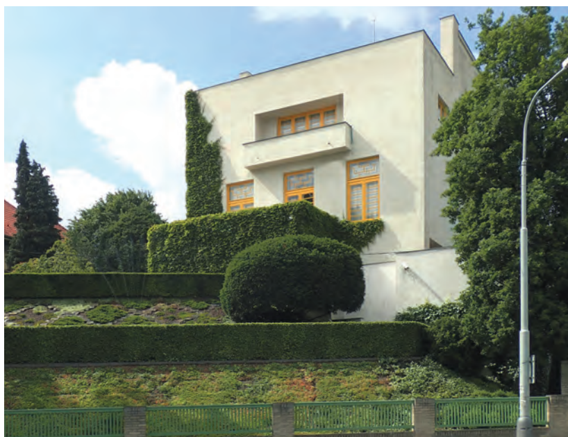
Müllerova vila, svahová část zahrady se stylizovanou skalkou

Vila se nachází při Střešovické ulici. Již z dálky viditelný bílý hranol budovy je členěn balkonem a arkýřem kubických tvarů a několika terasami, z nichž střešní je doplněna betonovou pergolou. Fasáda je oživena okny se žlutě natřenými rámy různých tvarů a různé výšky, která odpovídá vnitřnímu dispozičnímu uspořádání. Zahrada je vetknuta do svahu v několika úrovních. Překonává převýšení 11 metrů. Podobá se tak překvapivě obytnému prostoru vily, který je v přízemí také členěn do nestejných výšek